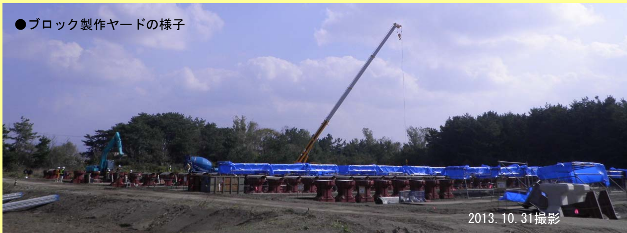
① 型枠を組み立てる準備